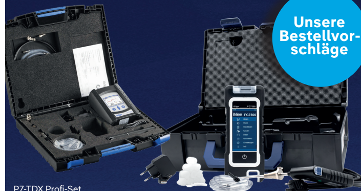
P7-TDX Profi-Set für Druck- u. Dichtheitsmessungen

Sonderkonditionen auf das Werkzeugsortiment